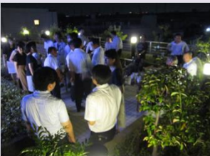
本社地区納涼祭(本社屋上)