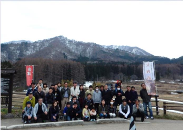
柏崎地区家族慰安旅行(芦ノ牧温泉)

社員の各種クラブ活動、家族慰安行事、慶弔行事の為に「互助会」があります。 会社が給付する補助金と、社員からの拠出金で運営しています。 各地域の運営委員が適宜課題を持ち込み、職場の意見などを話し合える場も設けています。